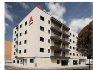
Hotel Alora Mérida