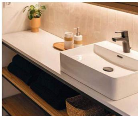
PANAM EVO XTREME