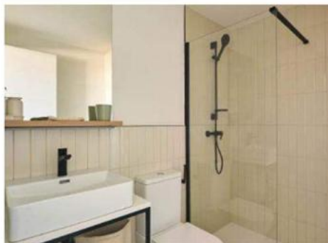
Hotel Node Alcobendas Momentum Reim Madrid